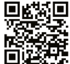
Warum frische Luft gesund ist