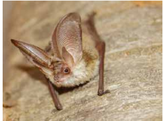
Graues Langohr

Viele einheimische Fledermäuse sind gefährdet. Mit zum Teil einfachen Massnahmen kann ihnen geholfen werden. Wir bauen am Nachmittag einen Fledermauskasten und erfahren Interessantes über das geheime Leben der Fledermäuse. Beim Eindunkeln versuchen wir auf einer Exkursion Fledermäuse zu beobachten.