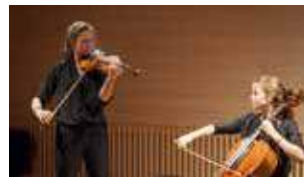
Geige und Cello