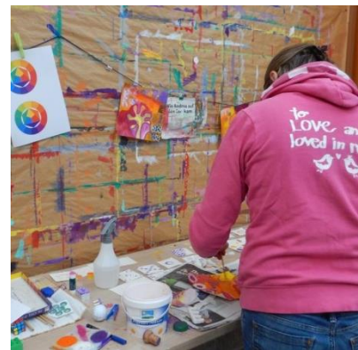
Impressionen vom März `17